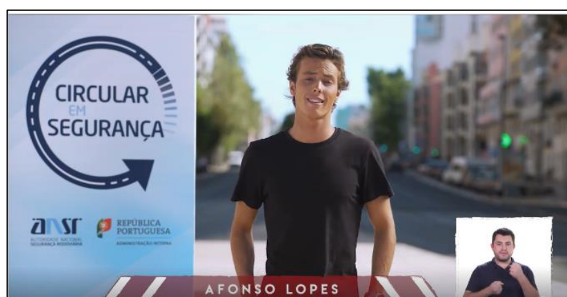
Spot 1 – Velocidade: Gravidade do Sinistro

Durante o período da campanha foram divulgados três spots de vídeo, com incidência na gravidade do sinistro, na velocidade como um fator de risco, e nos conceitos de velocidade excessiva e excesso de velocidade.