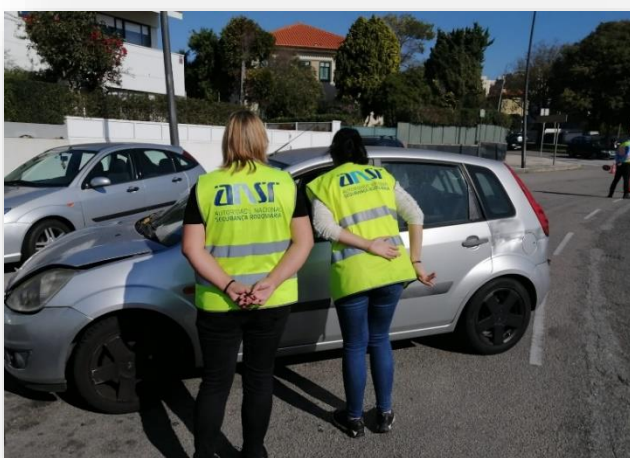
Dia 13 de outubro Av. Marechal Gomes da Costa Porto

A ANSR esteve presente, em conjunto com a GNR e com a PSP, em cinco ações de sensibilização no Porto, Braga, Leiria, Santarém e Lisboa, em locais onde a prevalência de acidentes é elevada, tanto em contexto urbano como em estradas nacionais e autoestradas.