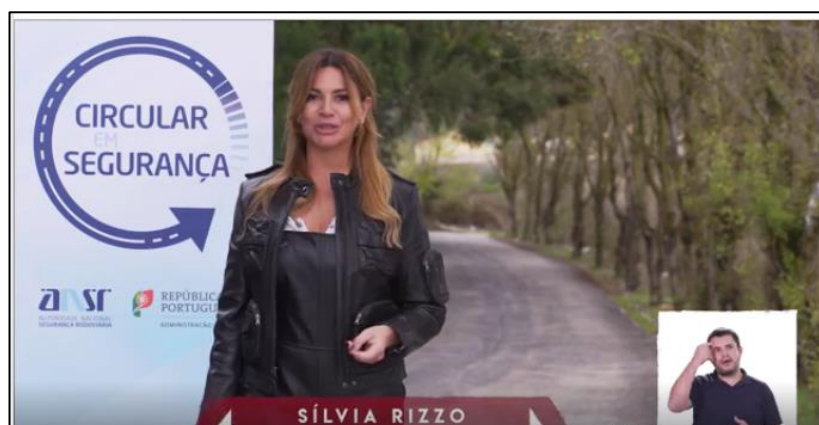
Spot 3 - Velocidade: Velocidade Excessiva e Excesso de Velocidade