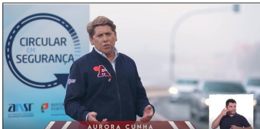
Spot 2 - Velocidade: Fator de Risco