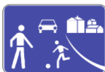
H46 - Zona residencial ou de coexistência.