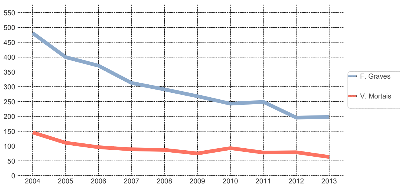
Evolução das vítimas mortais e feridos graves