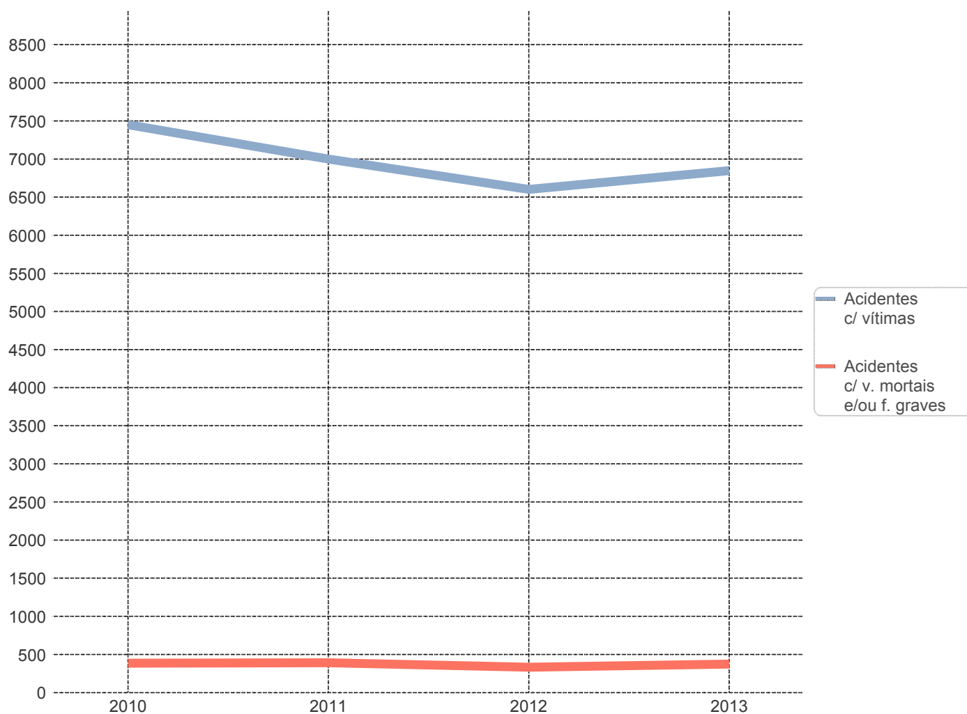
Evolução dos acidentes c/ vítimas e acidentes c/ v. mortais e/ou f. graves