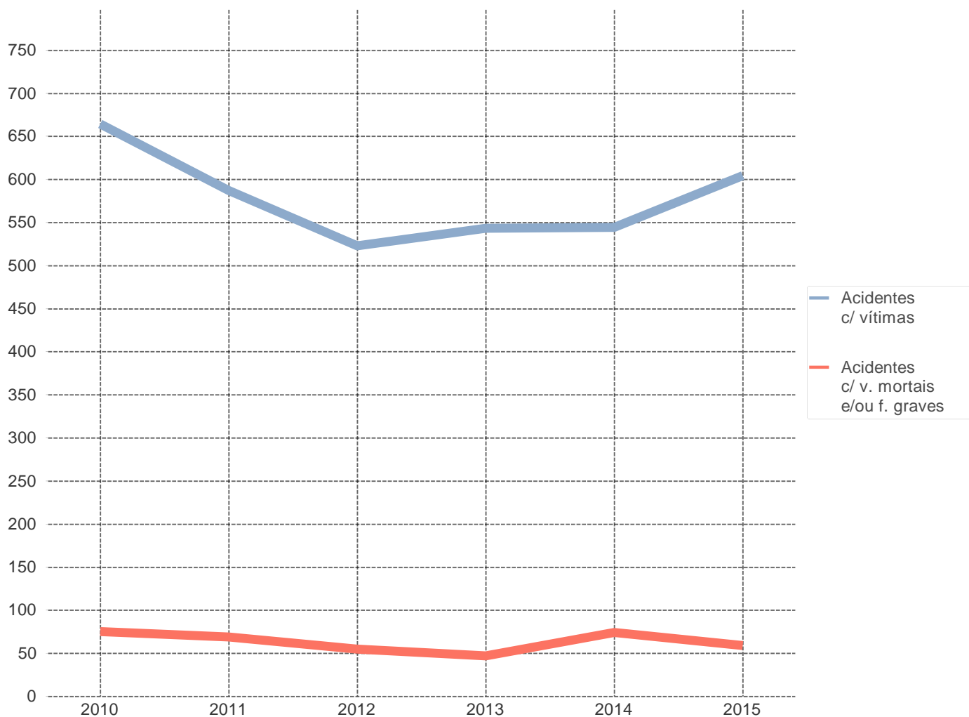
Evolução dos acidentes c/ vítimas e acidentes c/ v. mortais e/ou f. graves