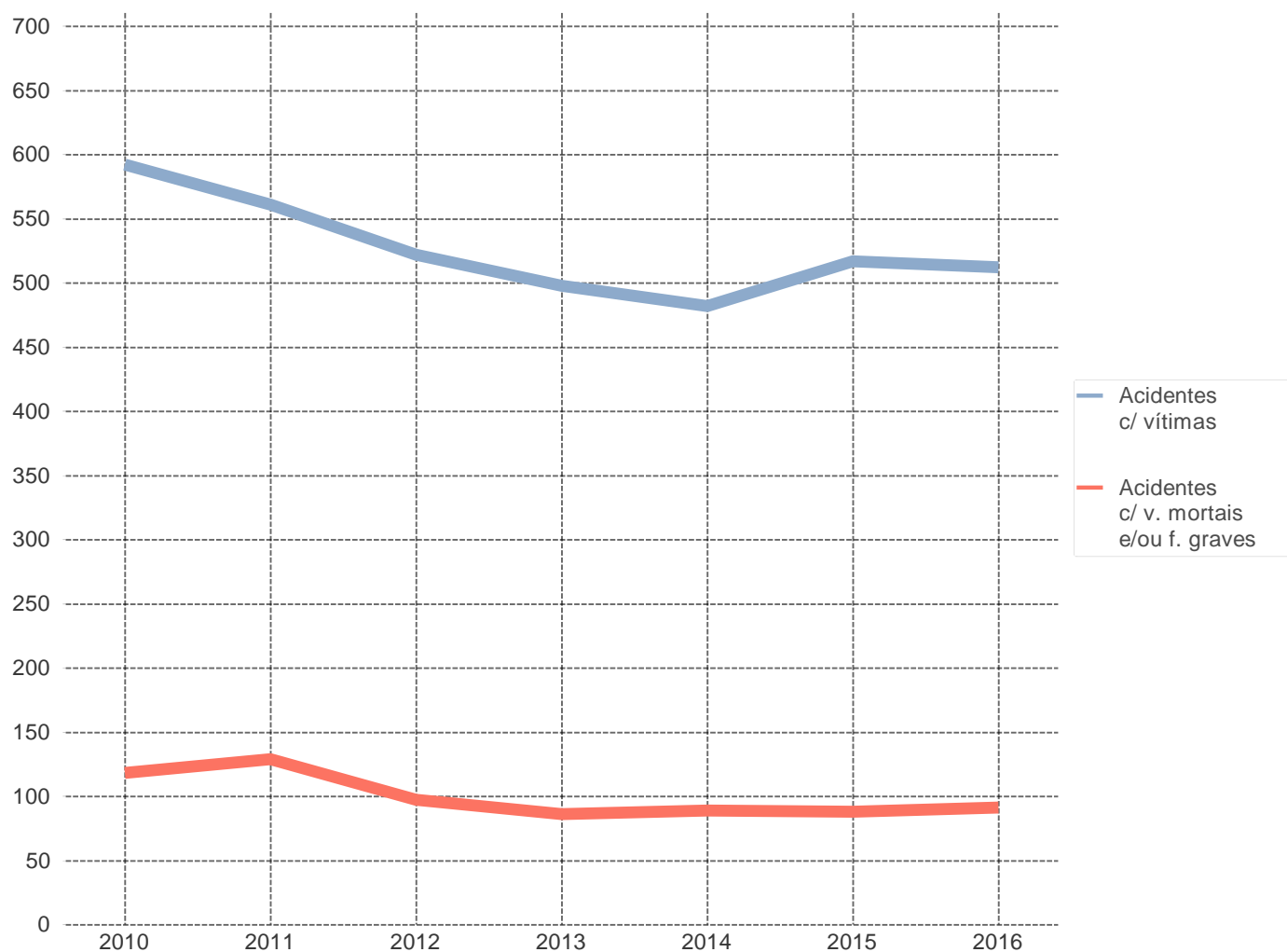
Evolução dos acidentes c/ vítimas e acidentes c/ v. mortais e/ou f. graves