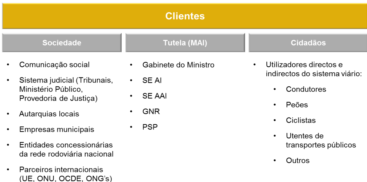
Figura 5.1 – Clientes da ANSR

Algumas entidades fiscalizadoras com que a ANSR se relaciona consideram que a ANSR é uma entidade fornecedora de serviços. No entanto, devido à natureza da sua atividade e à ligação existente entre a ANSR e estas entidades, quer em termos protocolares e legais quer de sistemas de informação, estas relações são estabelecidas e consideradas como parcerias ou colaborações entre a ANSR e essas mesmas entidades fiscalizadoras e não como de uma qualquer prestação de serviço.